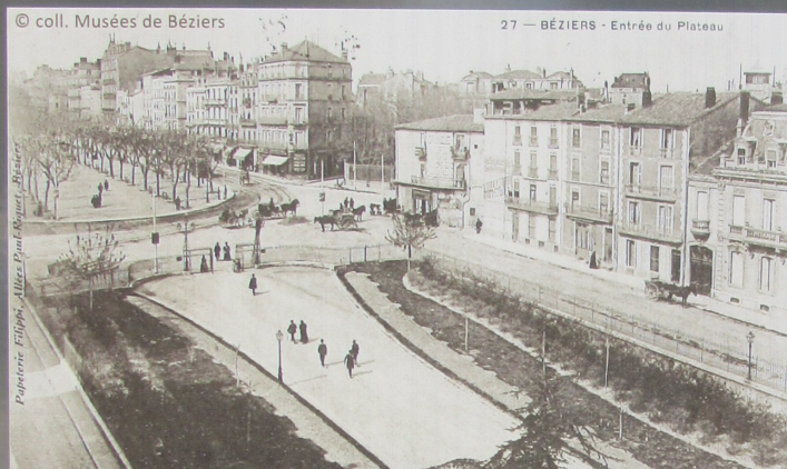
L'entrée du Plateau des Poètes au tout début du XX e siècle